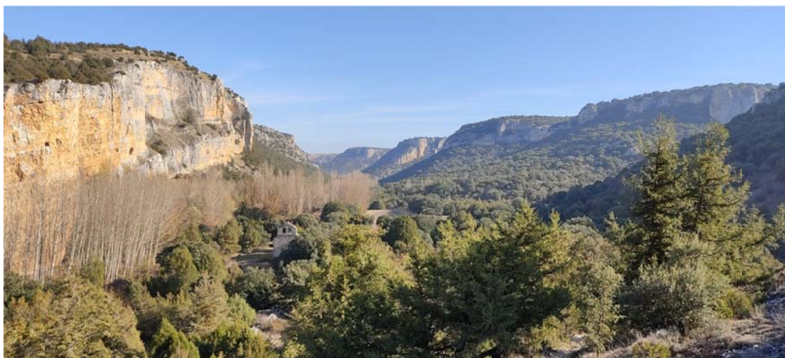
La ermita de El Casuar y su entorno. (Fotografía: Francisco Jesús Fernández Herrera. 13 de noviembre de 2021.)

El 13 de enero es el 47 aniversario de la inauguración de los Refugios de Montejo y del embalse de Linares, administrados respectivamente por WWF España y la CHD; entre Segovia y Burgos, junto a Soria. Fue casi el primer espacio protegido en Castilla y León, cuando había muy pocos en España. En 2021, el convenio del Refugio, entre WWF y el ayuntamiento de Montejo, se renovó por diez años más y por unanimidad.