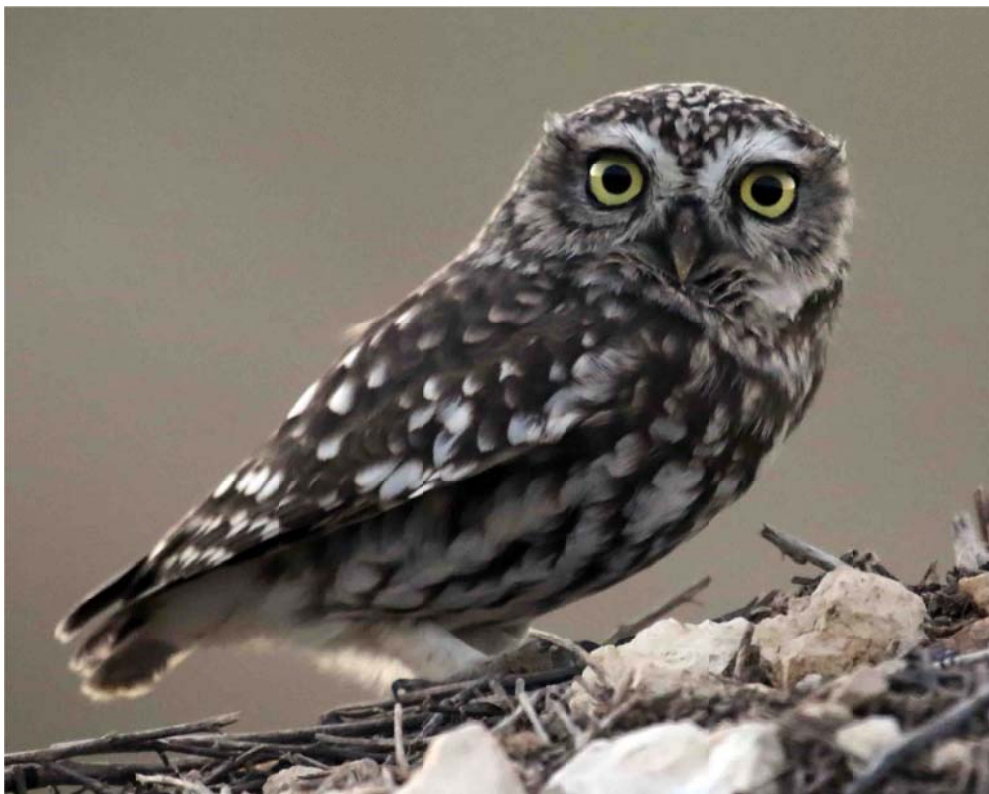
Mochuelo entre Torregalindo y la autovía, en el margen izquierdo del Riaza. (Fotografía: Juan José Molina Pérez. 6 de noviembre de 2021.)