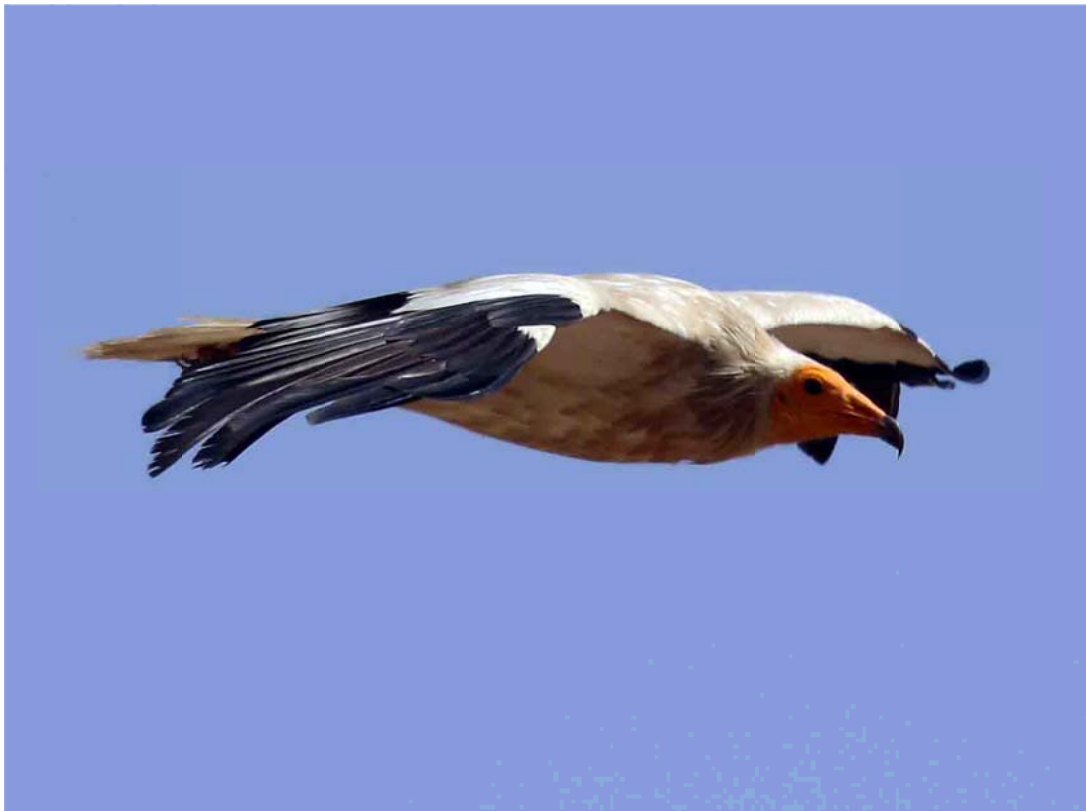
Alimoche adulto, cerca del comedero de buitres de Campo de San Pedro. (27 de agosto de 2021.)