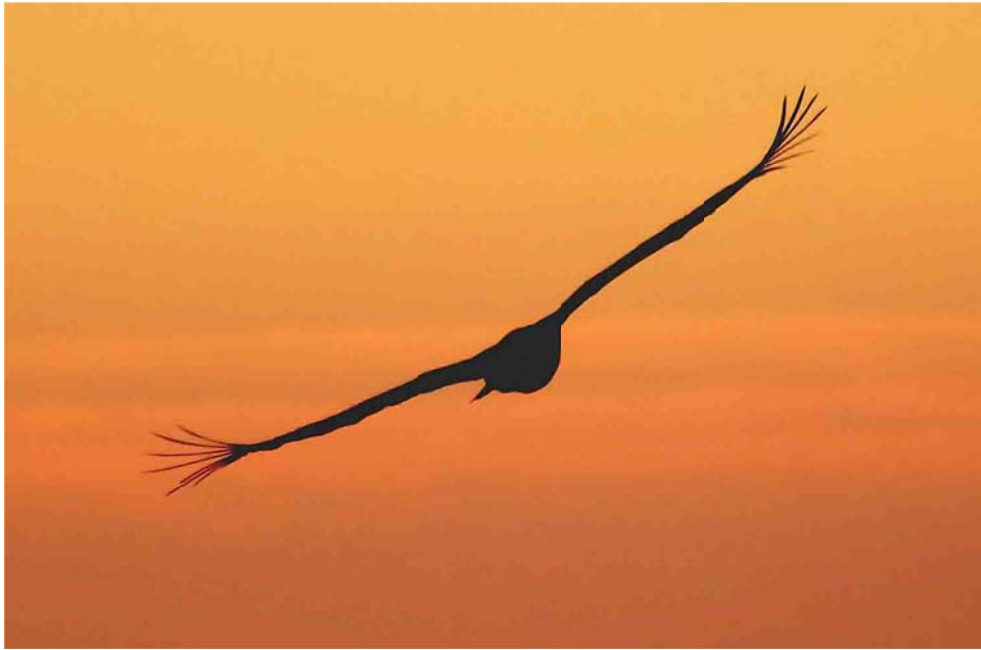
Buitre negro cerca del río Riaza, en el sur de Burgos.