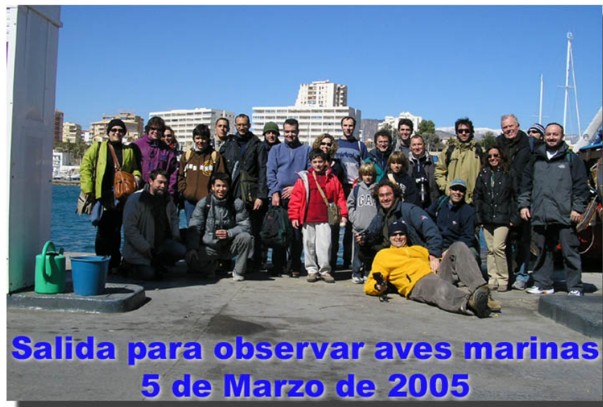
Los participantes en la salida en barco para observar aves marinas. La crónica puede consultarse en la web.