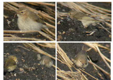
Mosquitero Común abietinus