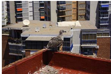
Nido de Gaviota Patiamarilla en un edificio de Benidorm