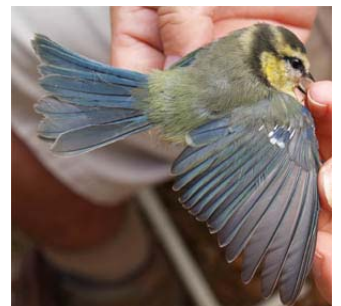
Herrerillo anillado en la Font Roja