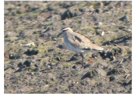
Avefría Sociable© José Llacer