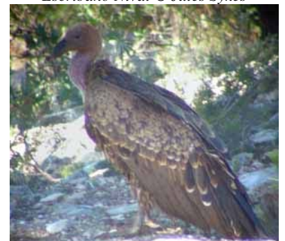
Buitre de Ruppell