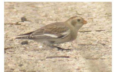
Escribano Nival © Jules Sykes