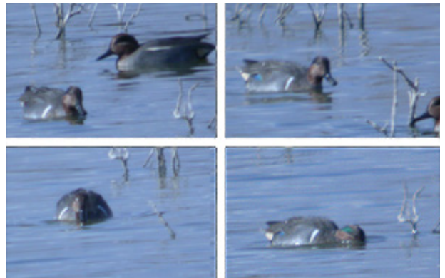
Imágenes de la Cerceta Americana.