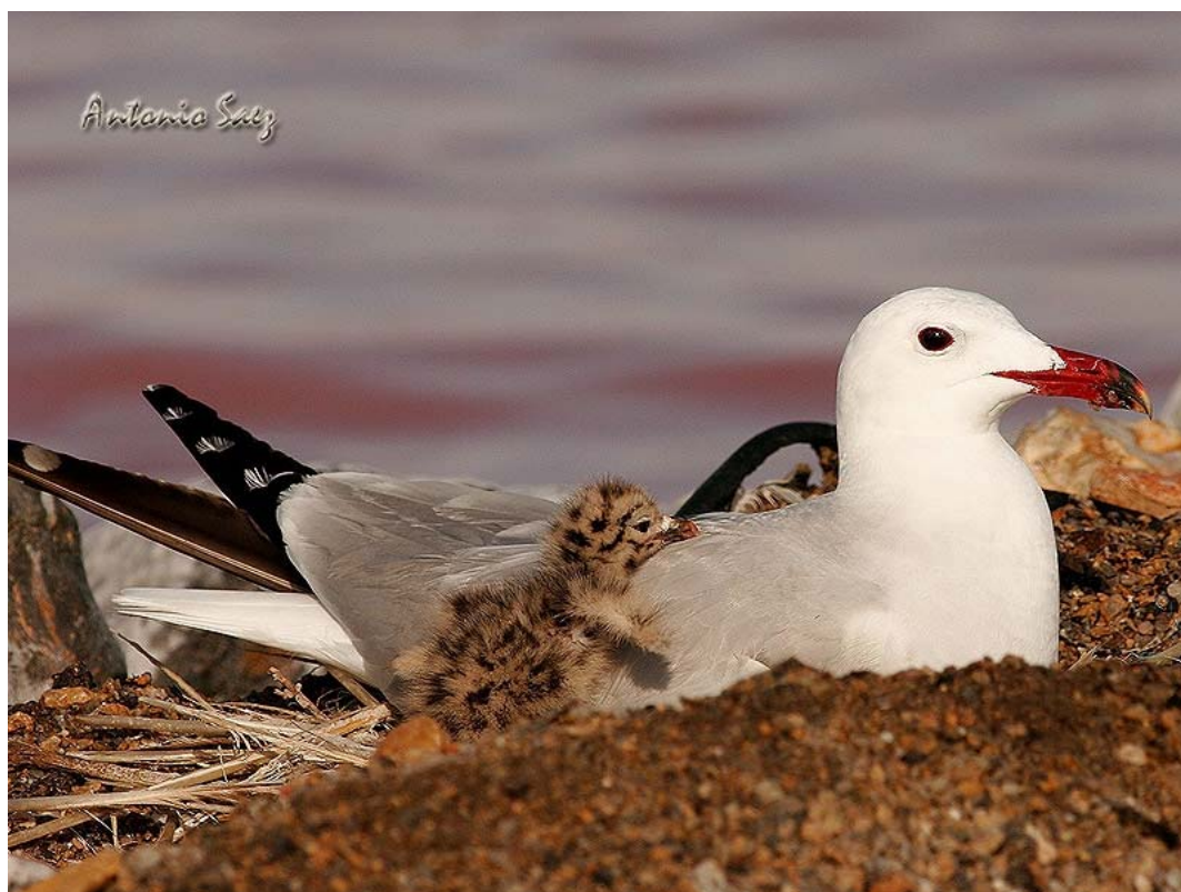
Una de las buenas noticias de 2005 fue la cría con éxito por primera vez en muchos años, de la Gaviota de Audouin en Alicante. En la foto, uno de los nidos de la Laguna de La Mata.